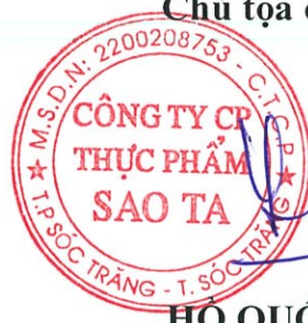
HỒ QUỐC LỰC